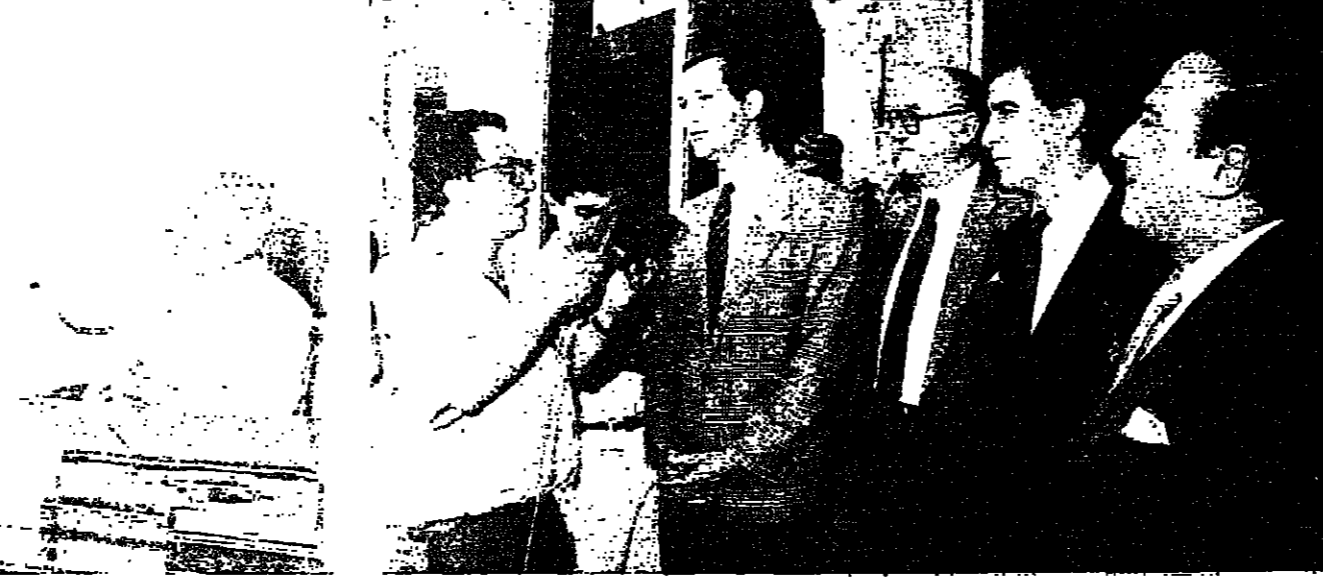
... وعمل ايوبان قصر بعيدا